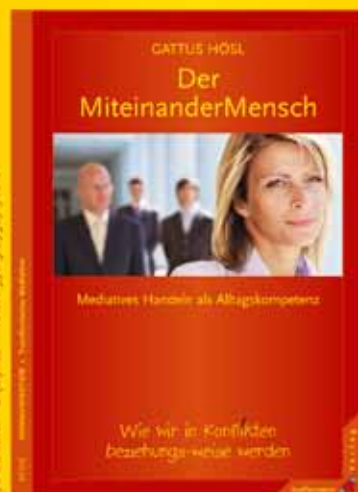
Gattus Hösl Der MiteinanderMensch Wie wir in Konflikten beziehungs-weise werden.

176 S., kart., € (D) 18,- • ISBN 978-3-87987-716-0