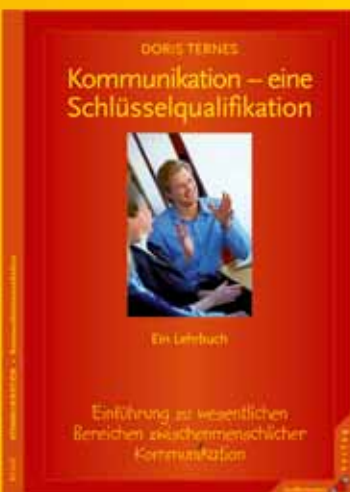
Doris Ternes Kommunikation – eine Schlüsselqualifikation Einführung zu wesentlichen Bereichen der zwischenmenschlichen Kommunikation.

224 S., kart., € (D) 22,- • ISBN 978-3-87987-705-4