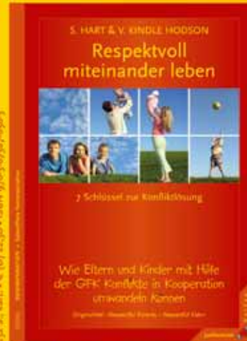
Sura Hart & Victoria Kindle Hodson Respektvoll miteinander leben 7 Schlüssel zur Konfliktlösung.

322 S., kart., € (D) 22,90 • ISBN 978-3-87987-698-3