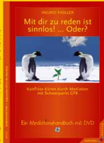
Ingrid Holler Mit dir zu reden ist sinnlos! ... Oder? Konflikte klären durch Mediation mit Schwerpunkt GFK.

325 S., geb., mit DVD • € (D) 29,90 • ISBN 978-3-87987-729-0